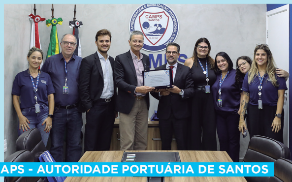
APS - AUTORIDADE PORTUÁRIA DE SANTOS