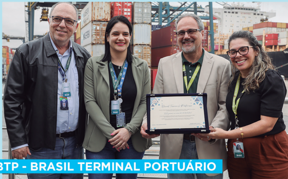
BTP - BRASIL TERMINAL PORTUÁRIO