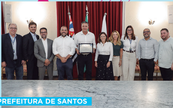
PREFEITURA DE SANTOS