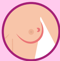
RETRAÇÃO DA PELE