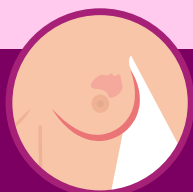
VERMELHIDÃO NA PELE