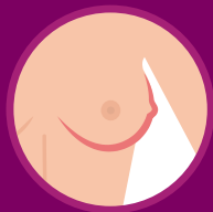
NÓDULO GERALMENTE INDOLOR