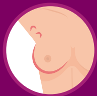
NÓDULOS NAS AXILAS