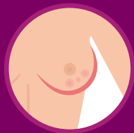
MUDANÇAS DE COR